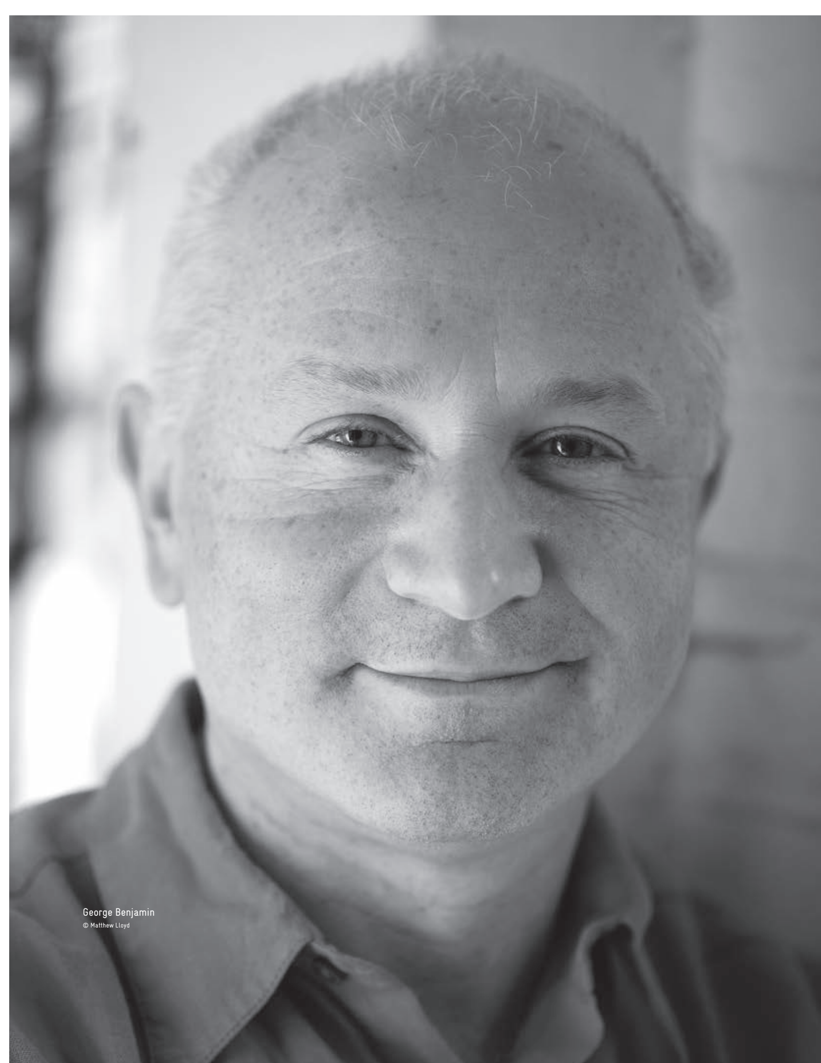
George Benjamin

Lundi 30 septembre n°26 / 20h30 / UGC Ciné Cité Opéra au cinéma Une avant-première ARTE The Perfect American